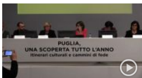
"Puglia, una scoperta tutto l'anno": mix tra turismo e cultura