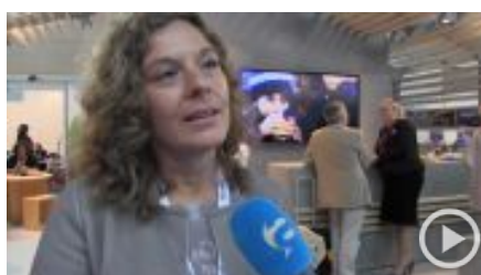
Turismo, Trentino: l'inverno parla russo, l'estate in coreano