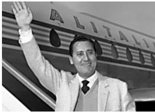
Alitalia deve riassumere i licenziati