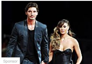
Belen Rodriguez e Stefano De Martino si lasciano...