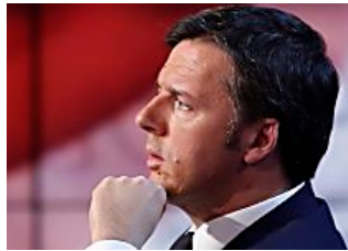
Denunciati i pm delle spese di Renzi