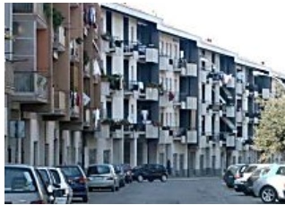
Sfrattati dai Pm i Vip delle case popolari