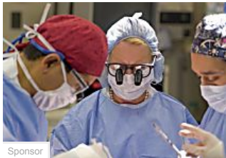
Diabete, intervento chirurgicopiù efficace dei... (Corriere)