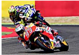
Rossi, operazione remuntada: ecco perché crederci