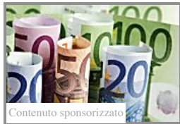
Contenuto sponsorizzato Come guadagna chi investe nel trading online? (Marketing Vici)