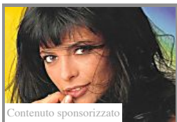
Contenuto sponsorizzato Com'è diventata e cosa fa oggi per mantenersi Natalia Estrada (Social Excite)