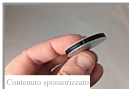
Contenuto sponsorizzato Come localizzare gratis la tua auto tramite cellulare? (Gadgetsfans)