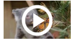
Il koala e la sua amica farfalla