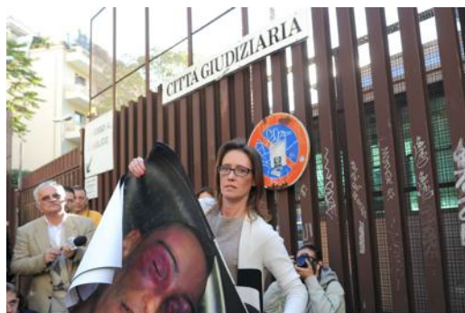
Ilaria Cucchi